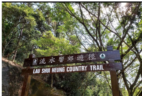
流水響圖片只作參考