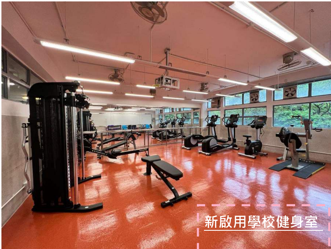
新啟用學校健身室

學校計劃進行一系列改善工程，包括構建宗教及靈性培育資源中心，讓同學能在一個有濃厚宗教氣息的地方，更專心地投入上宗教倫理課。雨天操場改建為半開放式食堂，創建一個有利促進交流的紓壓地方，為學生提供較舒適的用膳、討論、分享、社交、研討、做功課及小型表演的休閒場地。另外，學校亦已獲得「學校啟動計劃」撥款，將重鋪六樓有蓋空間地面，讓全校師生可以持續善用舉辦各項體育藝術活動。為進一步改善全校音響設備，將 24 間常用課室安裝全新擴音機、揚聲器及無線咪，藉以訓練學生多表達，提升教學效能。禮堂設置新的音響系統，讓演出者及參與者有更好的表現。