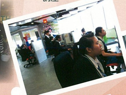
參觀勞工處「青年就業起點」