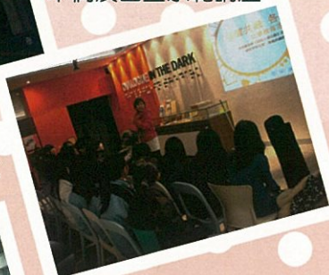
「黑暗中對話」體驗教育工作坊