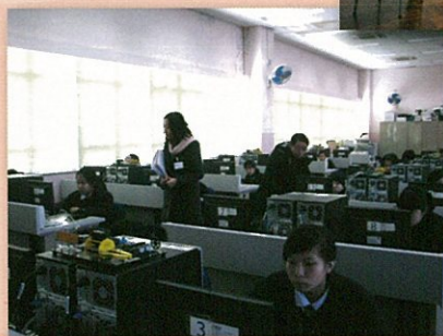
外評人員觀察課堂學習情況