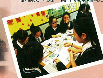
生涯規劃——成功在夢