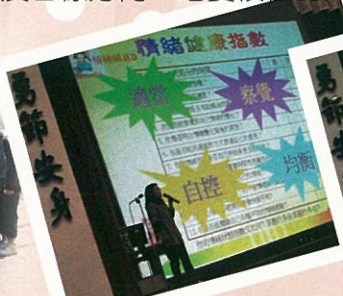
校園計劃「情緒睇真D」講座