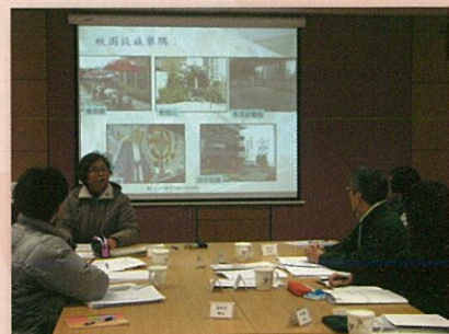
校長區修女總述學校的整體發展

在全體教師的耕耘下，學生普遍自律守規，勇於服務，關愛他人，體現「寶血人」精神。家長認同學校的方向，並欣賞學校對其子女在德育方面的培訓。在策劃未來的發展時，本校將參考外評人員給予的回饋建議，進一步提高學與教的效能，靈活調適教學策略，適時跟進學生的學習難點，加強發展高階思維能力，培養學生的自學習慣，努力推動學校持續發展。