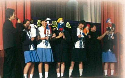
「下弄上木偶」中國傳統木偶演出暨示範講座