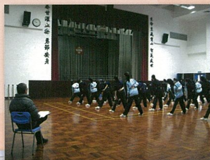
外評人員觀察學生進行課堂活動