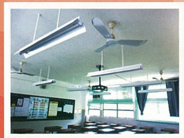
課室更換光管後的新貌

總務組於本學年向「環境及自然保育基金」及「環境保護運動委員會」成功申請了三十多萬元，將課室原設的T8光管，更換為T5高能源效益的光管照明系統，特此鳴謝。T5光管比舊有的光管可節省能源高達50%，水銀含量則可減少80%；而且，T5光管可帶出仿自然光線的效果，減低眼睛出現疲勞的現象。詳情參閱 http://resources.pbss.edu.hk/~affairs/lighting.htm