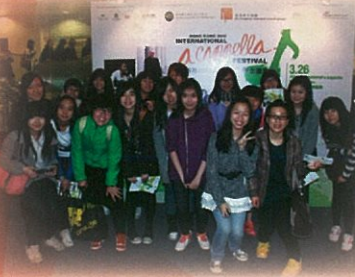
香港2011國際無伴奏合唱節