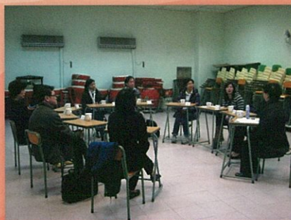
外評人員與家長交流