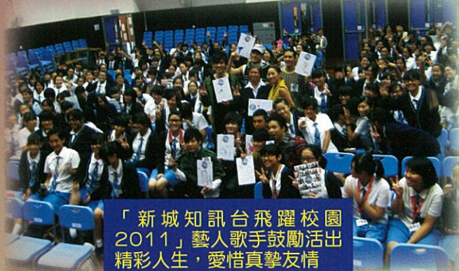
「新城知訊台飛躍校園2011」藝人歌手鼓勵活出精彩人生，愛惜真摯友情