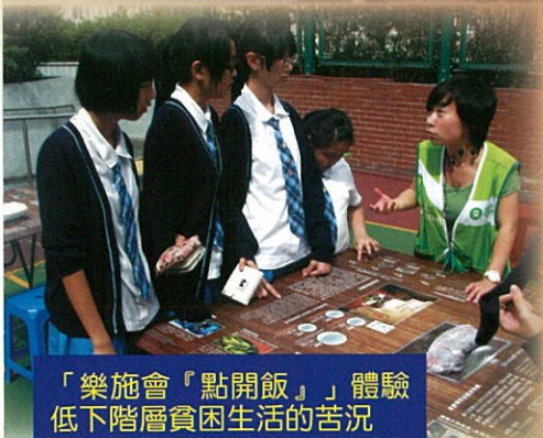
「樂施會『點開飯』」體驗低下階層貧困生活的苦況

我欣賞 學校的校工。 (請填上你欣賞的人或事.....) 他們風雨不夜，時時留守在學校，忍受着枯燥的煎熬，為學校裏的所有人服務。他們那敬業樂業、投入工作的精神，是值得學習的。 **請於背面寫上姓名班別學號**