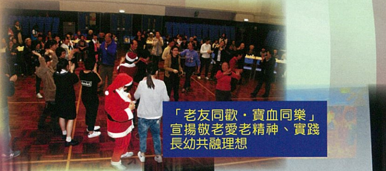
「老友同歡·寶血同樂」宣揚敬老愛老精神、實踐長幼共融理想