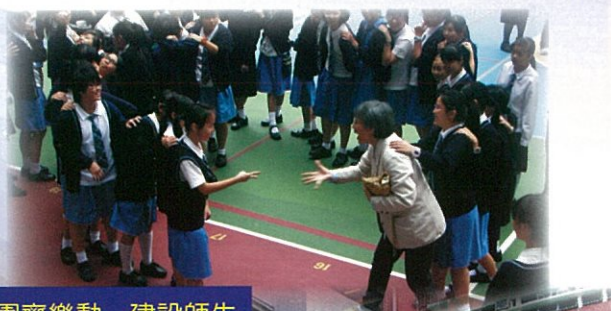
「和諧校園齊樂動」建設師生互動、友愛共融的校園氣氛

為彰顯耶穌寶血「犧牲與修和」的精神，本校一直致力陶成學生「尊重關愛」的寶血人素質，以建立和諧共融的社群。學生事務處恆常藉多元化的德育課程與課外活動施行全人教育，本學年仍一如既往，舉辦多姿多采的主題式大型活動，推動學生實踐寶血精神，傳揚天主是「愛與喜樂」的訊息。