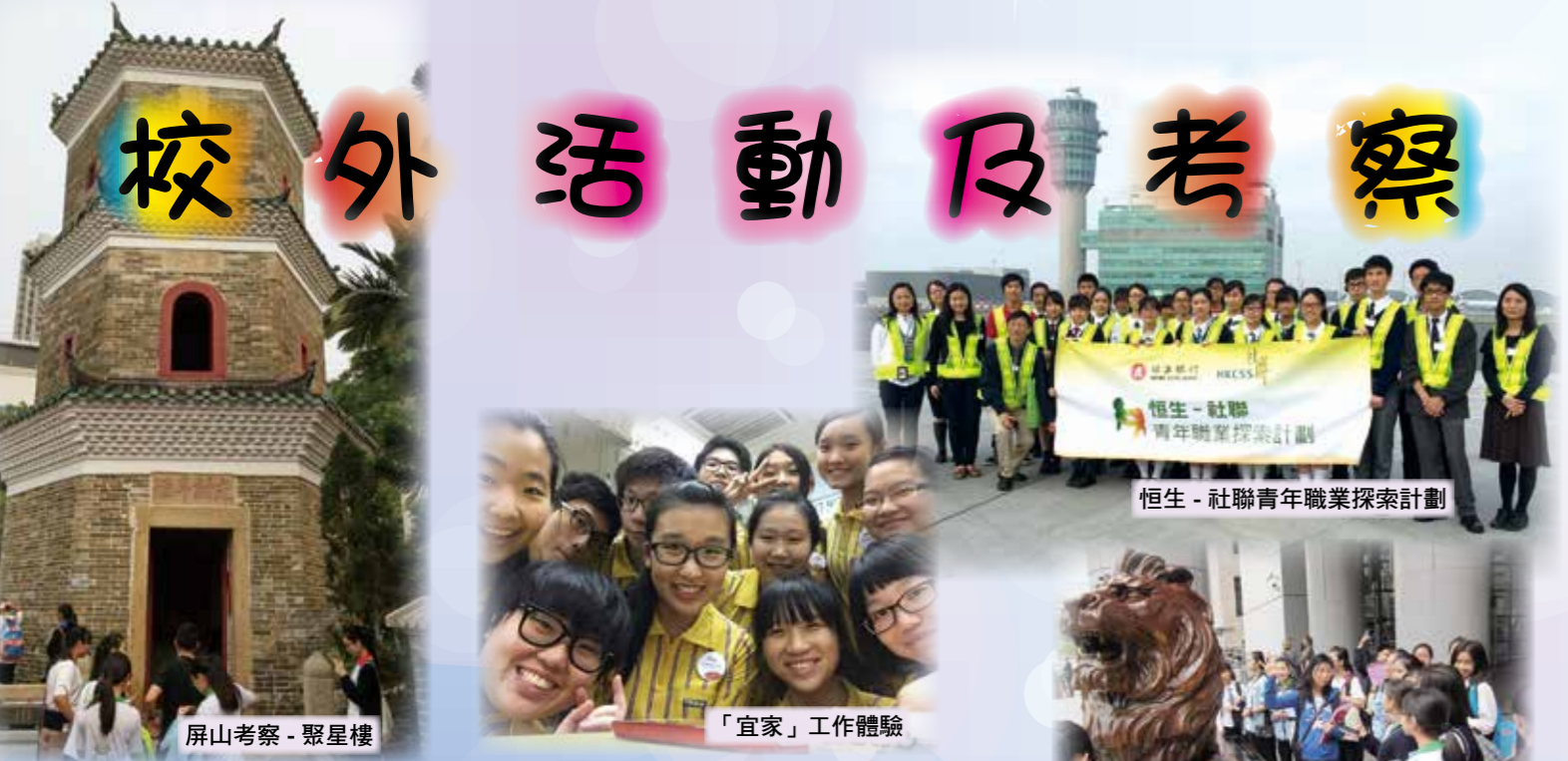
屏山考察 - 聚星樓