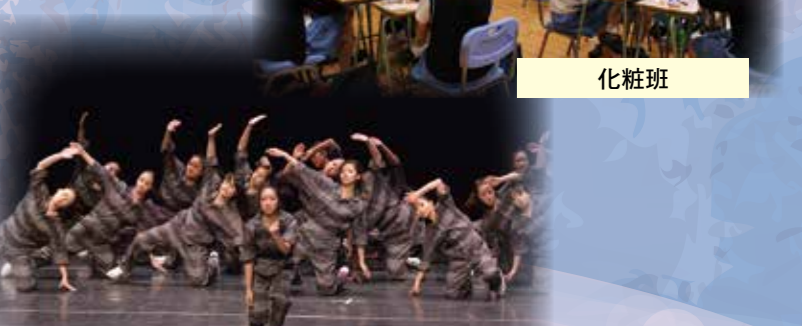
第51屆學校舞蹈節 中學組爵士舞及街舞 (群舞)甲級獎