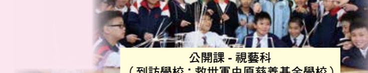
公開課 - 視藝科 (到訪學校：救世軍中原慈善基金學校)