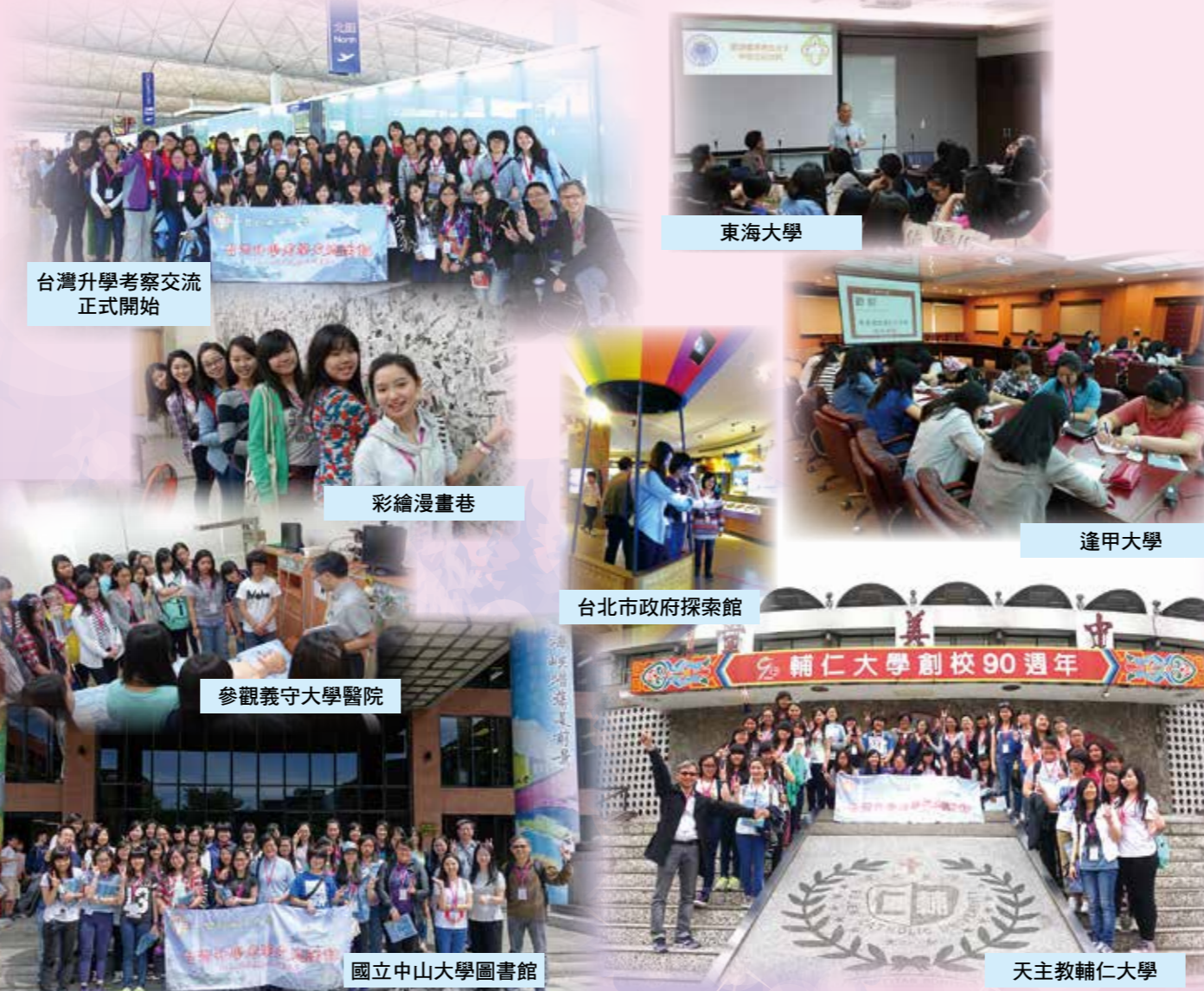
台灣升學考察交流正式開始