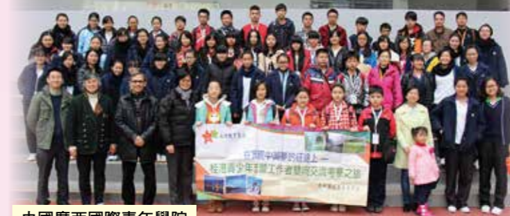
中國廣西國際青年學院及希望高中到訪交流