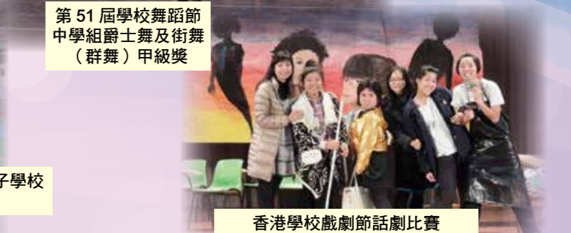
香港學校戲劇節話劇比賽