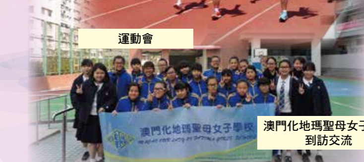
澳門化瑪聖母女子學校到訪交流