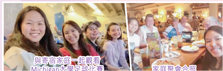
與寄宿家庭一起觀看 Michigan大學足球比賽