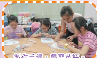
製作手繩，學習英語。

寶血·升Together，是活動的序幕，本校於七、八月份亦舉辦了不少有趣的學科體驗活動，令同學在輕鬆的氣氛下學習。