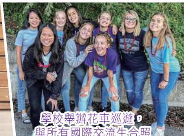
學校舉辦花車巡遊， 與所有國際交流生合照

此外，學校亦有開設不同的語言課程，例如法語、西班牙語等。我修讀了西班牙語課程，起初我對於學習發出西班牙語的顫音感到十分困難，因為漢語、英語沒有相似的發音，但是經過反復努力練習，最後也學會了。