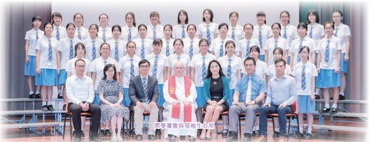
開學彌撒與領袖生合照

踏進2020年，標誌著我校邁進第七十五年，別具意義。寶血女子中學繼往開來，秉承校訓——智、義、勇、節的精神，盼與家長同心攜手，積極培養學生成為品德良好，樂於學習的寶血人。