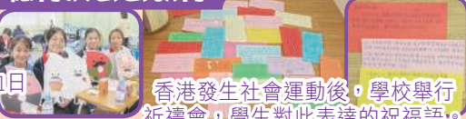
香港發生社會運動後，學校舉行祈禱會，學生對此表達的祝福語。