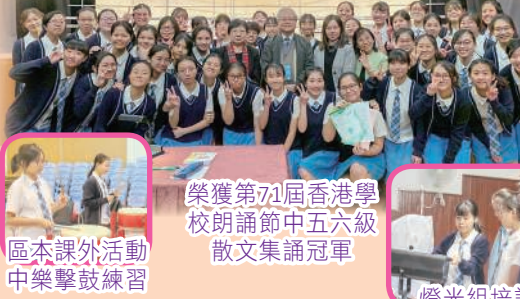
榮獲第71屆香港學校朗誦節中五六級散文集誦冠軍