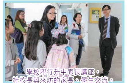
學校舉行升中家長講座，杜校長與來訪的家長、學生交流。

電子學習普及，毫無疑問已成為青少年獲取知識的有效方式，教師們必須與時並進，以創新的教學模式為學生設計電子學習體驗。不同的科目已積極推行iPad和電腦輔助教學，塑造新一代的智慧型教室。學校亦已設立了兩個創新科技實驗室，分別發展智能機械科技及生物科技，現已全面運作，為學生提供有趣的課程及活動。此外，我們亦構思把設計及視覺藝術的元素與科技教育融合，成為本校的特色科技課程。