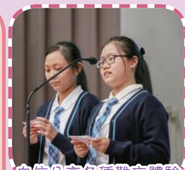
自信分享各種難忘體驗

開學後，經過一個多月的中學學習及生活適應，同學親身體驗作為寶血人的特色。九月的中一成長祝福禮，讓同學與家長、老師分享在不同活動中的快樂時光，留下美好回憶。