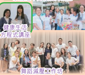
健康生活 方程式講座