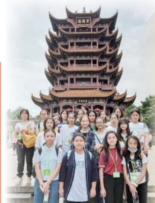
到臨黃鶴樓，感受 文學創作中的實地環境。