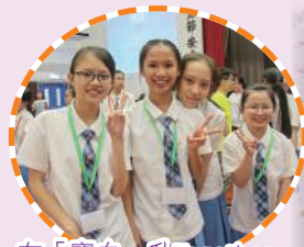
在「寶血·升Together」中認識了不少新同學

為了讓中一新同學更容易適應新的學習生活，校方於暑假期間，為新同學安排了不少多元化的活動，令她們在開課前已投入新的學習生活，認識新同學，適應新環境。