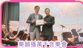
樂韻播萬千音樂會