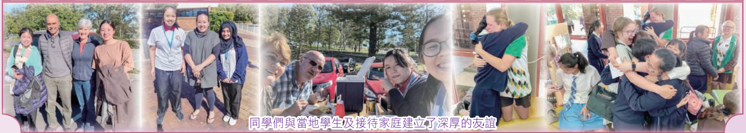
同學們與當地學生及接待家庭建立了深厚的友誼

這次交流活動，我所接觸的同學及接待家庭都十分熱情和友善。在澳洲，我和Buddy一起上了很多不同的課堂，如英文、設計、木工和體育課等，他們的課堂氣氛較輕鬆自由，學生都可按個人興趣作不同的嘗試。