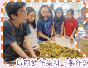
以廚餘作染料，製作紮染。

寶血·升Together，是活動的序幕，本校於七、八月份亦舉辦了不少有趣的學科體驗活動，令同學在輕鬆的氣氛下學習。