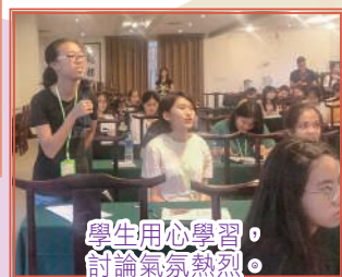
學生用心學習， 討論氣氛熱烈。