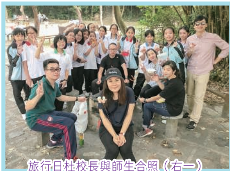
旅行日杜校長與師生合照（右一）