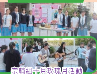
宗輔組十月玫瑰月活動