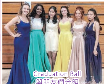
Graduation Ball 與朋友們合照

這一年海外交流的經歷使我成長，令我變得更堅強、獨立，也讓我更加了解自己真正想要的是什麼。 我在印第安納州的布魯克維爾(Brookville, Indiana, US)與當地寄宿家庭一起生活，並於當地公立高中(Franklin County High School)就讀12年級。這裏的老師和同學都非常熱情，讓我很快適應美國的生活。他們平日亦很主動與我討論有關香港的教育制度、中國文化等問題，原來美國人對中國文化十分好奇。我的文學老師對《孫子兵法》非常感興趣，我們亦經常討論中國的經典文學話題。他們意識到中國文化的博大精深，會反思自己對中國文化了解不足。