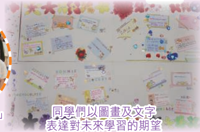
同學們以圖畫及文字表達對未來學習的期望