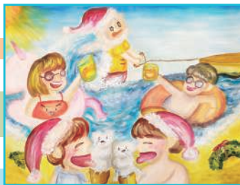
六望 蔣鈺琳 炎熱的聖誕節