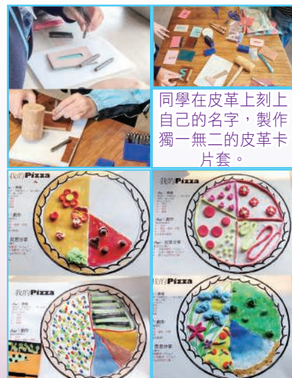
同學在皮革上刻上自己的名字，製作獨一無二的皮革卡片套。