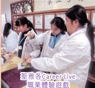
聖雅各Career Live 職業體驗遊戲