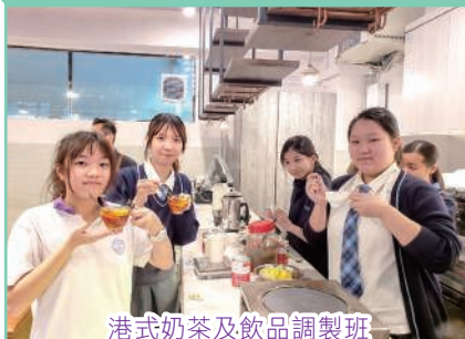
港式奶茶及飲品調製班

教師利用班主任課時段，與學生分享不同話題，進行品德培育，加強學生掌握合宜的處世態度，並適時提供身心良方，鼓勵學生正面思維。同時，學校社工及社區的支援網絡齊備，可以緊急援助有需要的同學。