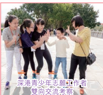
深港青少年志願工作者 雙向交流考察

成功的價值教育有賴全體教師的支持及不同持分者的配合和積極參與。本校以「全校參與」模式，結合認知、情感及實踐，推動價值教育發展。推行價值教育時，學校會透過課堂學習（各學科和成長課）、實踐體驗（其他學習經歷活動）及學習氛圍，為學生提供全面而均衡的學習經歷。期望同學經過六年的學習生活，既可活出「犧牲修和」和「智義勇節」的寶血人精神，亦可以培養七種首要的價值觀和態度。