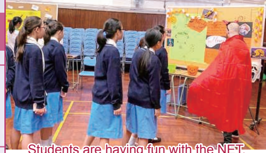
Students are having fun with the NET.