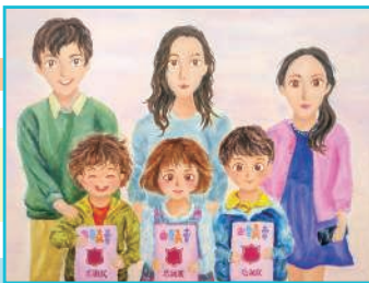
六敬 關鎮頌 真假義賣