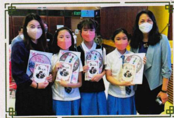
本校敬贈茶文化學習冊予形象大使郭晶晶女士（左1）