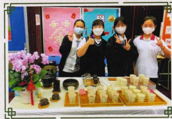
學生於癸卯兔年校友新春團拜時為來賓備茶