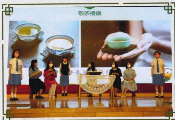
本校師生於禮行天下頒獎典禮上演繹以茶弘禮的學習成果