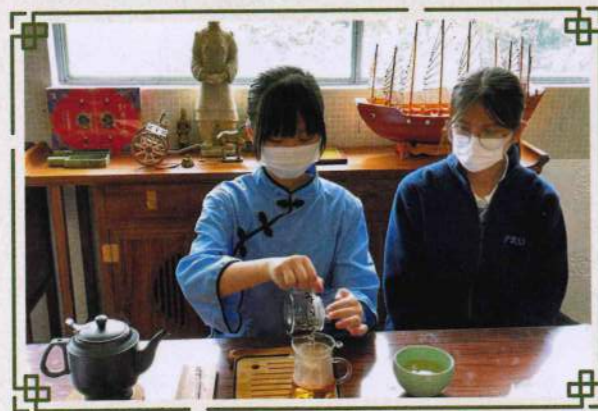
學生於中華文化室體驗泡茶的樂趣