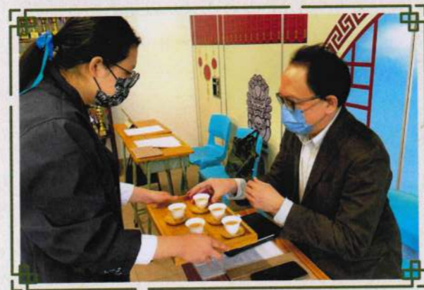
學生向教育局總課程發展主任（德育、公民及國民教育）譚家強博士奉茶，實踐敬茶禮儀。