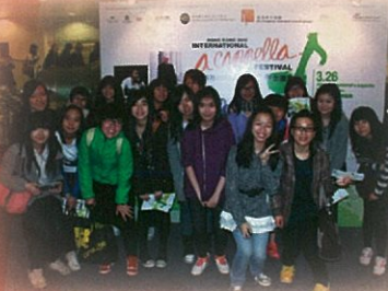
香港2011國際無伴奏合唱節