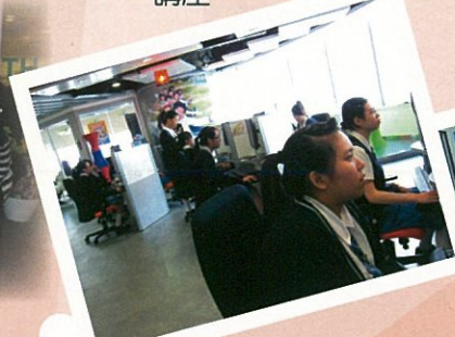
參觀勞工處「青年就業起點」