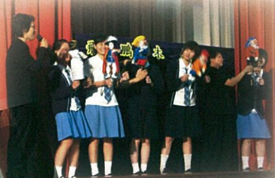
「下弄上木偶」中國傳統木偶演出暨示範講座