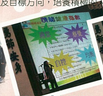
校園計劃「情緒睇真D」講座