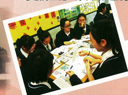
生涯規劃——成功在夢