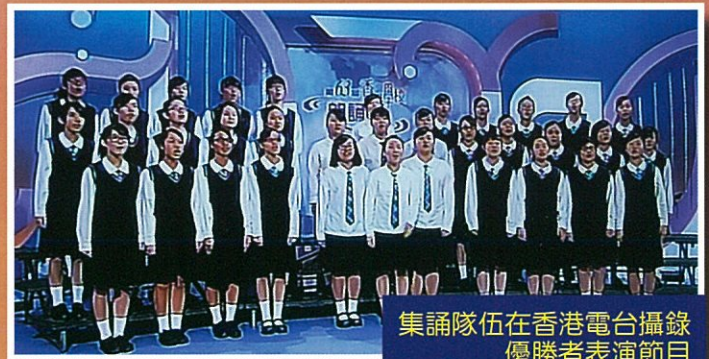
集誦隊伍在香港電台攝錄 優勝者表演節目