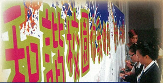
「四海龍王樂隊 — 音樂·少年·夢」許諾以行動表達尊重與接納，共建精彩人生