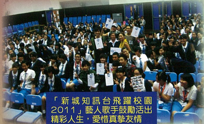
「新城知訊台飛躍校園2011」藝人歌手鼓勵活出精彩人生，愛惜真摯友情