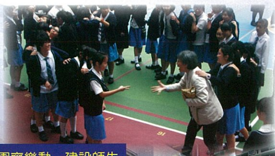
「和諧校園齊樂動」建設師生互動、友愛共融的校園氣氛

為彰顯耶穌寶血「犧牲與修和」的精神，本校一直致力陶成學生「尊重關愛」的寶血人素質，以建立和諧共融的社群。學生事務處恆常藉多元化的德育課程與課外活動施行全人教育，本學年仍一如既往，舉辦多姿多采的主題式大型活動，推動學生實踐寶血精神，傳揚天主是「愛與喜樂」的訊息。