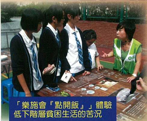
「樂施會『點開飯』」體驗低下階層貧困生活的苦況