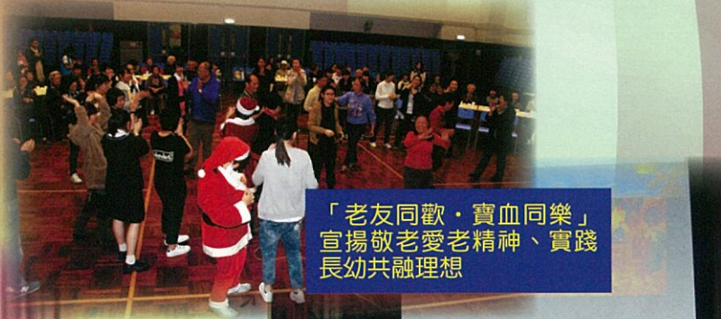
「老友同歡·寶血同樂」宣揚敬老愛老精神、實踐長幼共融理想