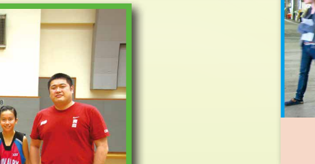
第二組港島女子學界籃球比賽——丙組決賽