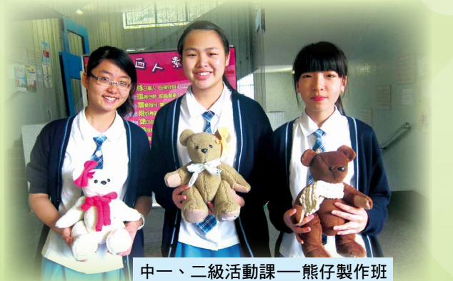
中一、二級活動課——熊仔製作班