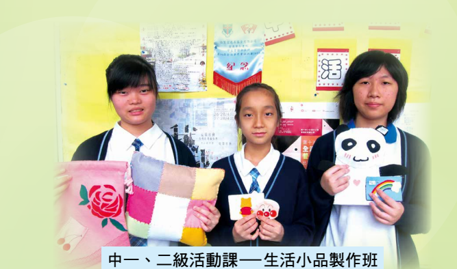
中一、二級活動課——生活小品製作班