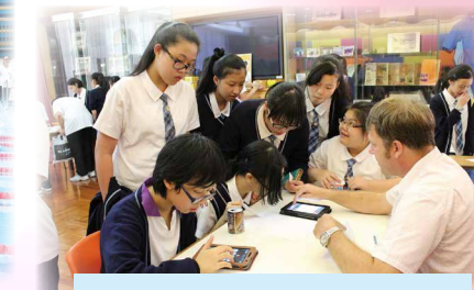
English Month Game Stall