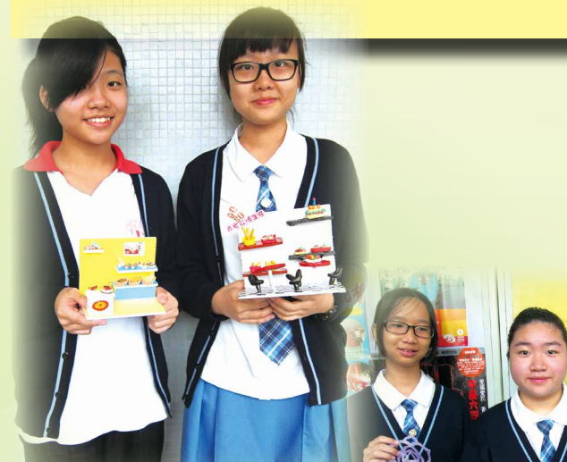
中一、二級活動課——迷你黏土手工藝班

We're really lucky to live in a great city like Hong Kong. We should be grateful to what we have. We shouldn't complain about not having this or that. Truthfully, we're lucky that we live a civil life.