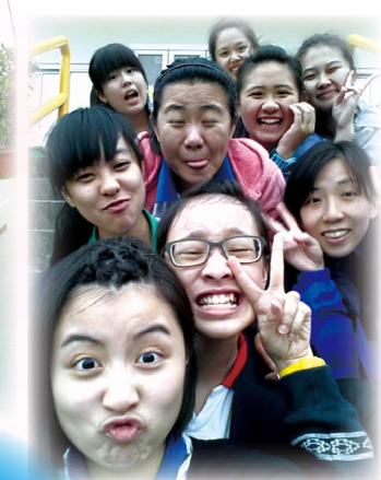
大腳八 - 智慧與合作的遊戲

成長是身心的歷練，面對困難時，恐懼、逃避、放棄都不是正面的想法。同學們仍記得成長營中攀繩網、下高台、紮木筏時的種種感受嗎？最後你們都能面對它、克服它——希望這些正念，已栽種在你心中，助你跨步向前。