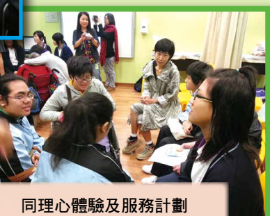
同理心體驗及服務計劃