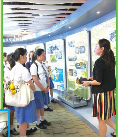
參觀海關總部大樓