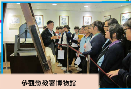
參觀懲教署博物館