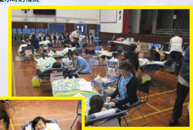
學生捐血時的情形