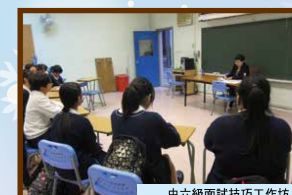
中六級面試技巧工作坊