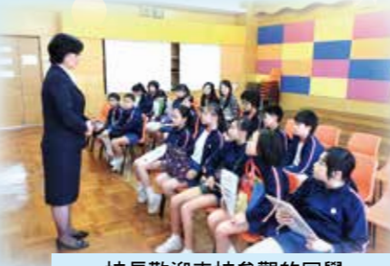
校長歡迎來校參觀的同學