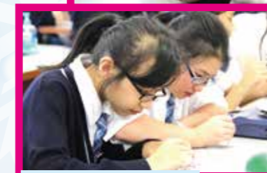
製作隱形墨水時的情況