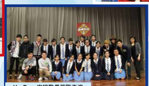
YesTour 安排歌星蒞臨表演