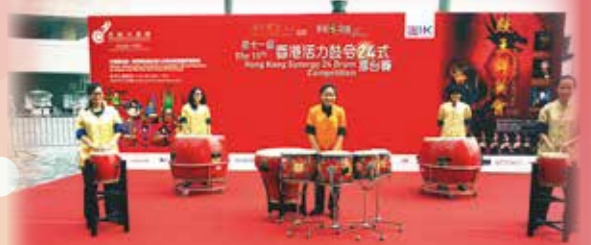
香港活力鼓令 24 式擂台賽 優異獎