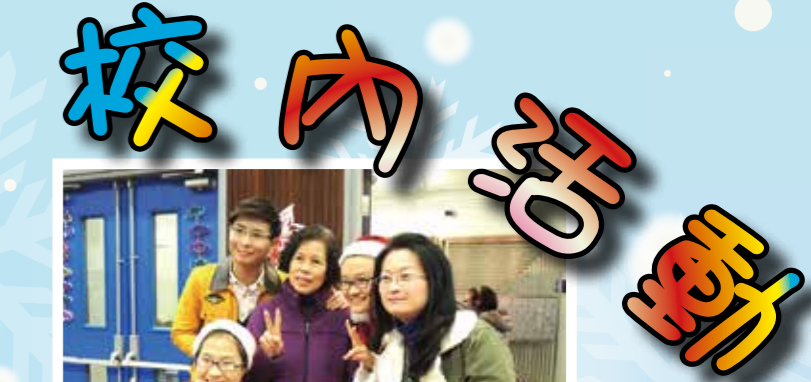
老友同歡寶血同樂