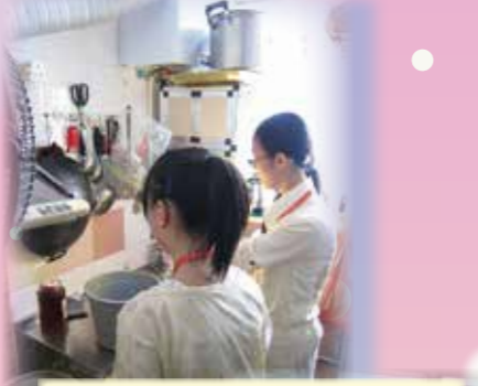
義工隊 獨居長者家居清潔活動