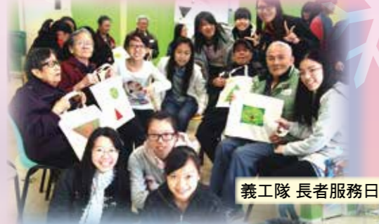
義工隊 長者服務日