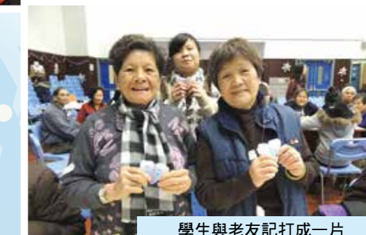
學生與老友記打成一片