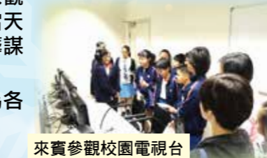
來賓參觀校園電視台