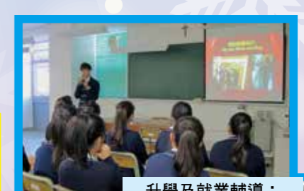
升學及就業輔導： 婚禮統籌師職業簡介