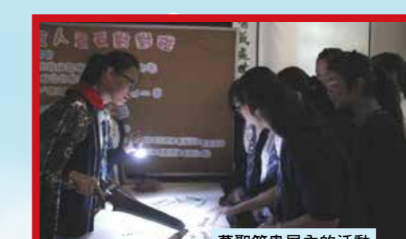
萬聖節鬼屋內的活動