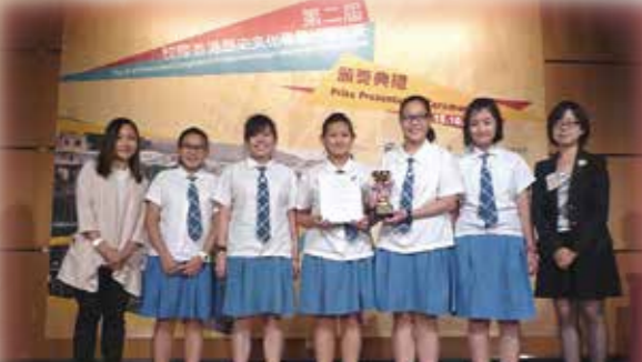
第二屆香港歷史文化專題研習比賽 高級媒體組 季軍