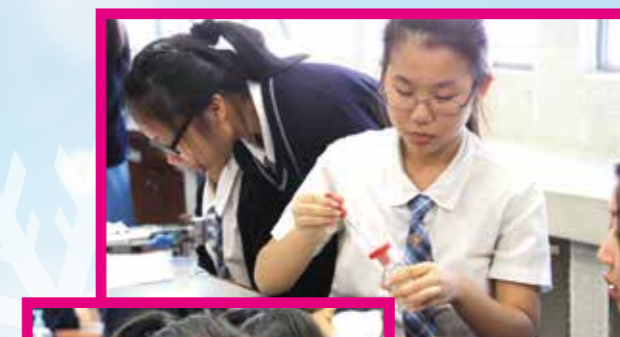
科學學會隱形墨水製作班