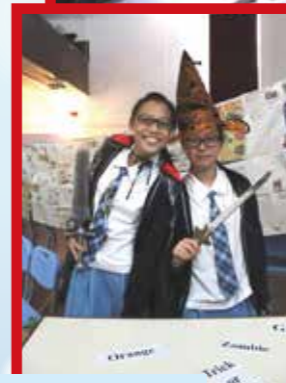
萬聖節的小鬼造型