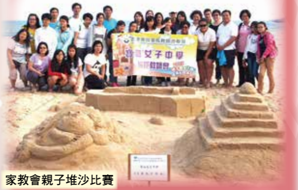
家教會親子堆沙比賽