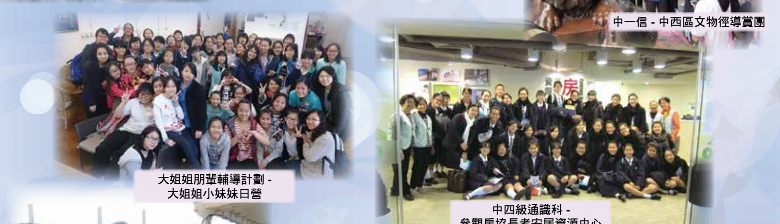
中四級通識科-參觀房協長者安居資源中心