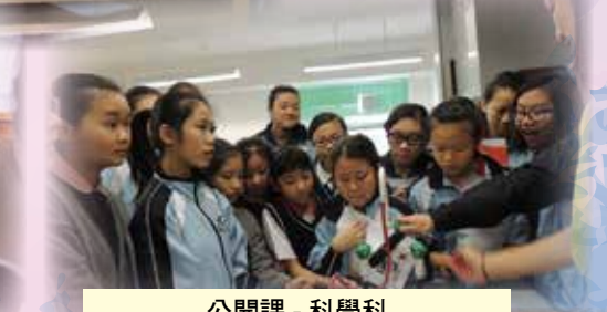
公開課 - 科學科 (到訪學校：筲箕灣官立小學學校)