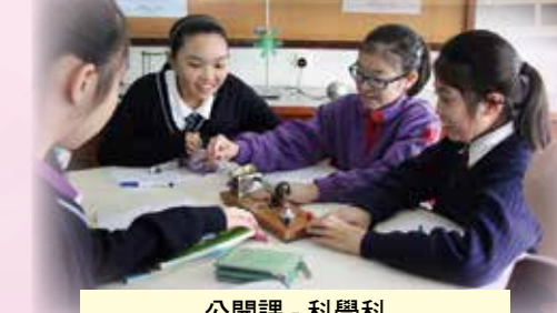
公開課 - 科學科 (到訪學校：佛教中華康山學校)