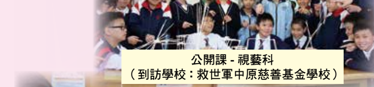
公開課 - 視藝科 (到訪學校：救世軍中原慈善基金學校)