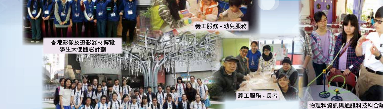
香港影像及攝影器材博覽 學生大使體驗計劃