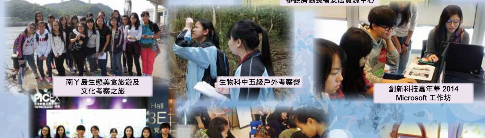
南丫島生態美食旅遊及文化考察之旅