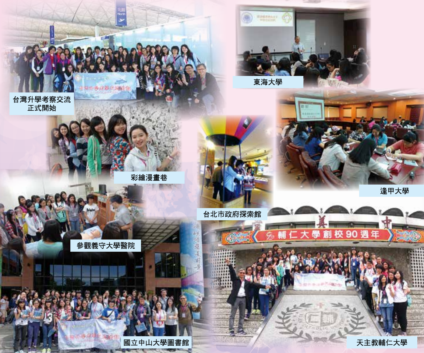
台灣升學考察交流正式開始