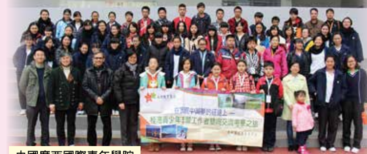
中國廣西國際青年學院及希望高中到訪交流