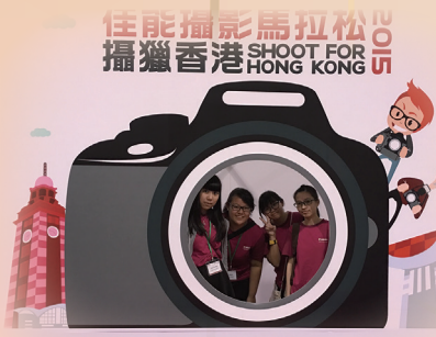
佳能攝影馬拉松 2015 佳能攝影馬拉松