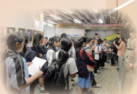
中二學生參觀海關大樓