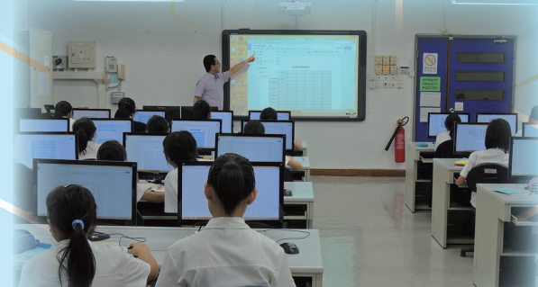
Promethean Multi-Touch Activboard 電子白板