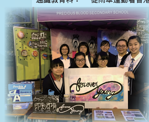
開放日「我要做老闆」攤檔