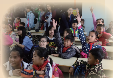
粵港青少年志願工作者 雙向交流的情況