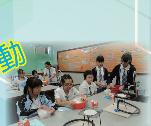
科學學會：雪糕製作班