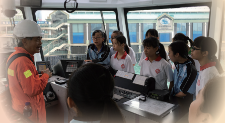
中一學生參觀 海事博物館