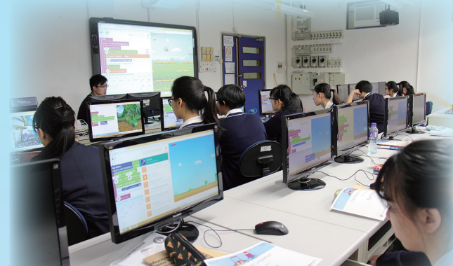
Microsoft Youth Spark Programme Hour of Code