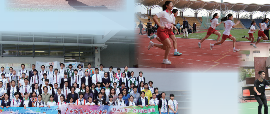
廣州市第九十七中學訪校