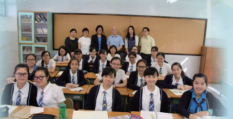
通識教育科：「從雨傘運動看香港政府管治」講座