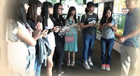
海事博物館 導賞工作體驗