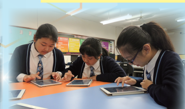
Mobile Learning with iPad Air 2