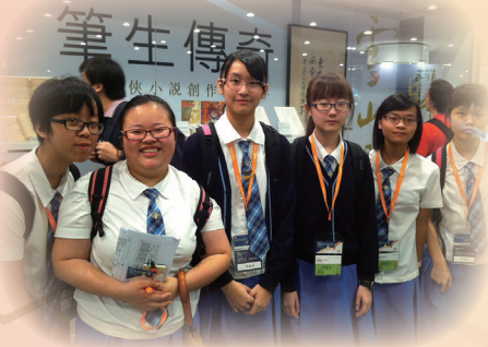
文藝導賞工作體驗