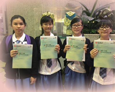
恒生社聯 1516 頒獎禮