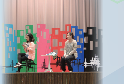
公民教育劇場學校巡迴演出 - 《現代灰姑娘》