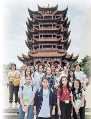
到臨黃鶴樓，感受文學創作中的實地環境。