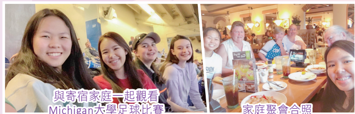
與寄宿家庭一起觀看Michigan大學足球比賽