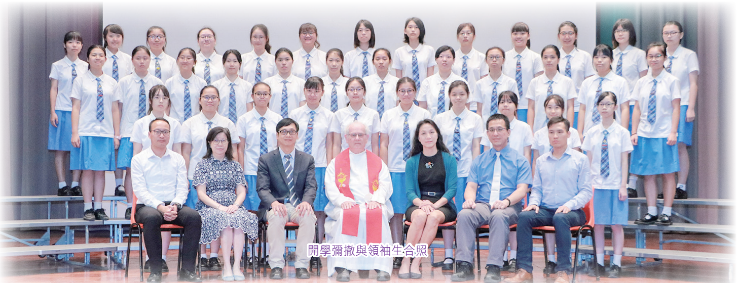
開學彌撒與領袖生合照

踏進2020年，標誌著我校邁進第七十五年，別具意義。寶血女子中學繼往開來，秉承校訓——智、義、勇、節的精神，盼與家長同心攜手，積極培養學生成為品德良好，樂於學習的寶血人。