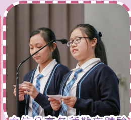
自信分享各種難忘體驗

開學後，經過一個多月的中學學習及生活適應，同學親身體驗作為寶血人的特色。九月的中一成長祝福禮，讓同學與家長、老師分享在不同活動中的快樂時光，留下美好回憶。