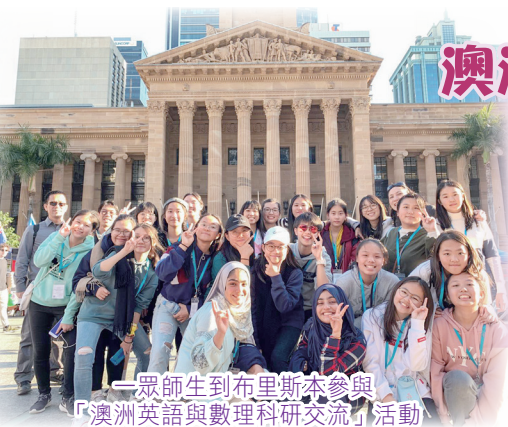
一眾師生到布里斯本參與「澳洲英語與數理科研交流」活動