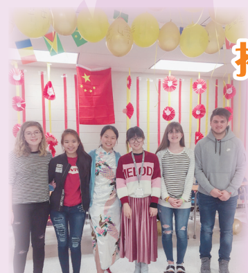
農曆新年時老師和同學一起舉辦慶祝派對(左三)

2018至2019年是我人生中既精彩又富有挑戰性的一年，因為有幸得到了「原來我得嘍」美國交流計劃獎學金的資助，讓我有機會與美國當地的高中生交流，從中體驗當地的獨特文化。當初參加這個計劃就是因為希望可以擴闊自己的眼界，了解不同的風土人情。