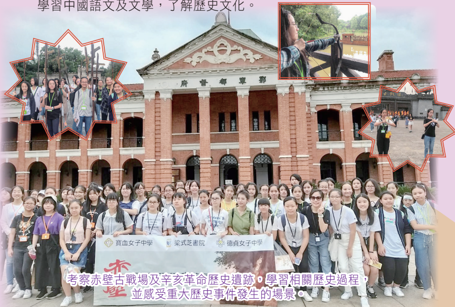
考察赤壁古戰場及辛亥革命歷史遺跡，學習相關歷史過程，並感受重大歷史事件發生的場景。

本校中國歷史科與德貞女子中學及梁式芝書院合辦「赤壁武漢研學團」，於2019年7月11日至2019年7月14日舉行，目的是讓學生藉考察活動學習中國語文及文學，了解歷史文化。