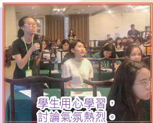
學生用心學習，討論氣氛熱烈。