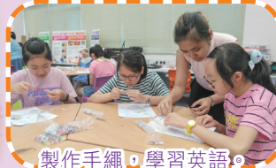
製作手繩，學習英語。

寶血·升Together，是活動的序幕，本校於七、八月份亦舉辦了不少有趣的學科體驗活動，令同學在輕鬆的氣氛下學習。