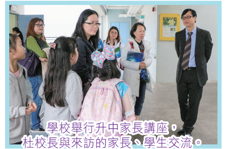
學校舉行升中家長講座，杜校長與來訪的家長、學生交流。

電子學習普及，毫無疑問已成為青少年獲取知識的有效方式，教師們必須與時並進，以創新的教學模式為學生設計電子學習體驗。不同的科目已積極推行iPad和電腦輔助教學，塑造新一代的智慧型教室。學校亦已設立了兩個創新科技實驗室，分別發展智能機械科技及生物科技，現已全面運作，為學生提供有趣的課程及活動。此外，我們亦構思把設計及視覺藝術的元素與科技教育融合，成為本校的特色科技課程。