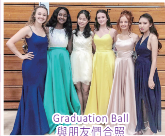
Graduation Ball 與朋友們合照

其次，美國自由的教育文化，亦與香港的教育制度相異，學生們需要自主學習課程內容及完成課業，考取學分進入心儀的大學。在美國學習的課堂上，老師往往只拋給你一個問題，讓你思考探究，這種「授之以魚不如授之以漁」的教育方式，不僅鍛鍊我的獨立思考能力，亦激發了我的求知精神，提升了個人學習的自主性。