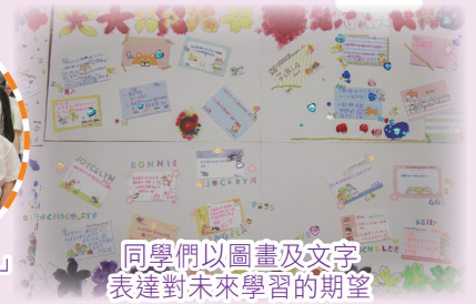
同學們以圖畫及文字表達對未來學習的期望