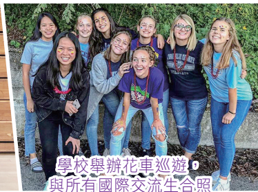
學校舉辦花車巡遊，與所有國際交流生合照

此外，學校亦有開設不同的語言課程，例如法語、西班牙語等。我修讀了西班牙語課程，起初我對於學習發出西班牙語的顫音感到十分困難，因為漢語、英語沒有相似的發音，但是經過反復努力練習，最後也學會了。