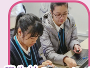
學生於Grace Lutheran College參與了5天充實的課堂活動