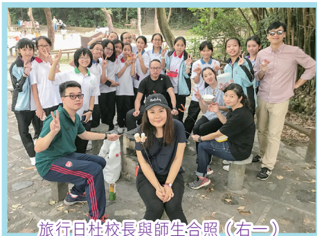
旅行日杜校長與師生合照（右一）