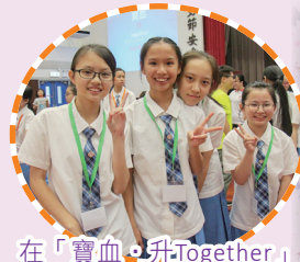
在「寶血·升Together」中認識了不少新同學

為了讓中一新同學更容易適應新的學習生活，校方於暑假期間，為新同學安排了不少多元化的活動，令她們在開課前已投入新的學習生活，認識新同學，適應新環境。