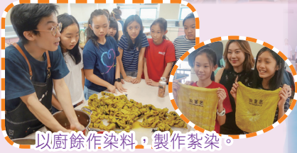
以廚餘作染料，製作紮染。

寶血·升Together，是活動的序幕，本校於七、八月份亦舉辦了不少有趣的學科體驗活動，令同學在輕鬆的氣氛下學習。