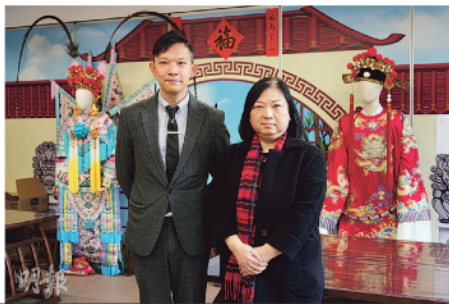
圖3-2 - 寶山女子中學今年錄錄3名「高才子女」，該校長（學生家長）曾……（隱匿身份）